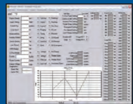
Windows™ basiertes Terminal Programm zur vereinfachten Konfiguration

Nur mit verwendung von abgeschirmten Kabelbäumen und Zündspulen